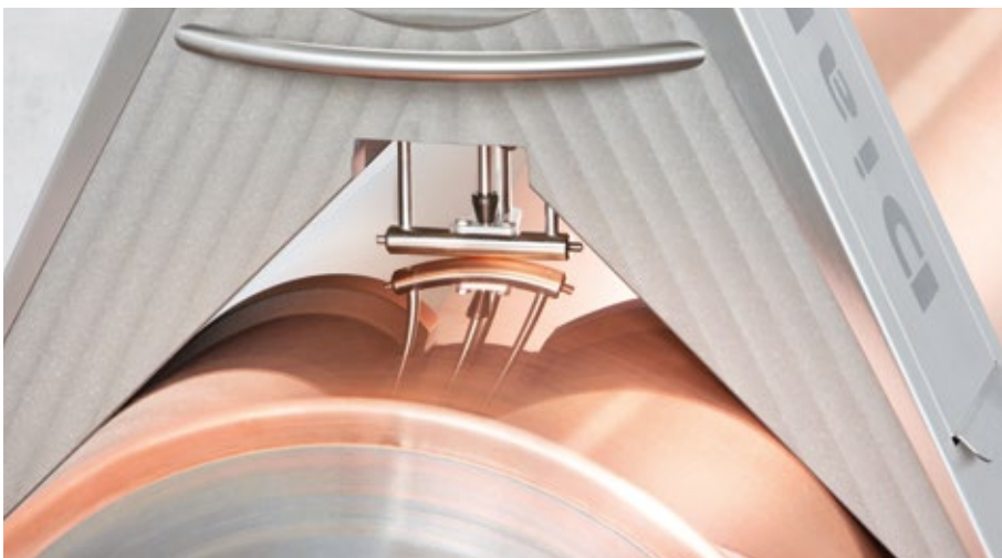
Tangential scanning with measuring bar Tangentiale Abtastung durch Messbalken