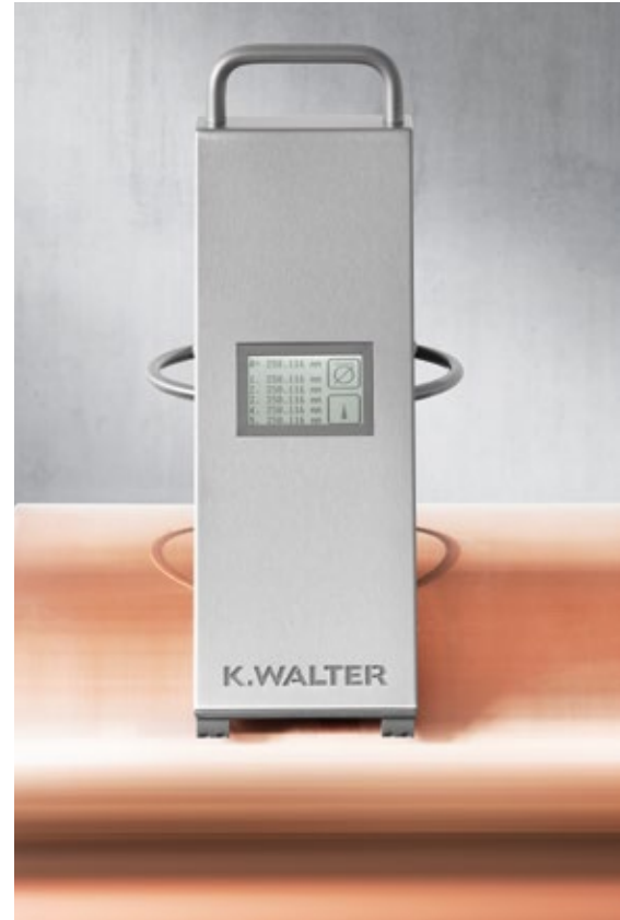
Handy device with touchscreen Handliches Gerät mit Touchscreen

Das DiaMet liefert schnell exakte, reproduzierbare Messwerte des Durchmessers und des Umfangs. Die Messeinrichtung liegt optimal auf vier geschliffenen Flächen auf und ist damit immer in der idealen Position zum Zylinder. Die Messung selbst erfolgt durch tangentielle Abtastung mittels eines integrierten Messbalkens. Das DiaMet verfügt über modernste Technik und ist dennoch sehr stabil und einfach in der Handhabung.