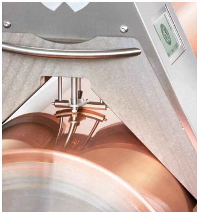
Temperature sensor and measuring bar Temperaturfühler und Messbalken

K.Walter unterstützt Kunden mit stabilen Prozessen für beste Ergebnisse. Mit eine Voraussetzung dafür: Leistungsfähige Messtechnik, die unter Produktionsbedingungen sichere Ergebnisse liefert und einfach zu bedienen ist. Messgeräte von K.Walter werden für die rasche und zuverlässige Ermittlung von reproduzierbaren Werten entwickelt und leisten damit einen wichtigen Beitrag zur Qualitätssicherung.